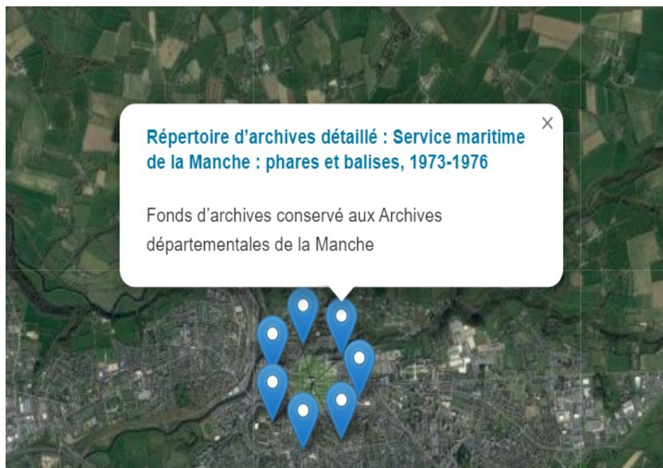
Géolocalisation des fonds d'archives concernant la Manche

https://ressources.histoire-environnement.org/Carte?filtre=ressources