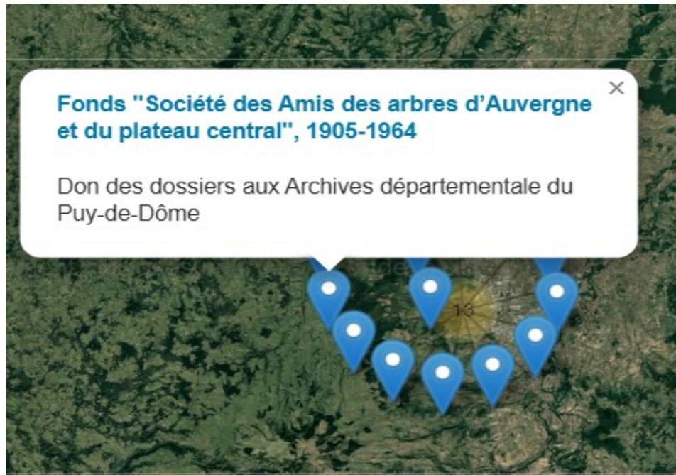
Géolocalisation des fonds d'archives concernant Le Puy-de-Dôme

https://ressources.histoire-environnement.org/Carte?filtre=ressources