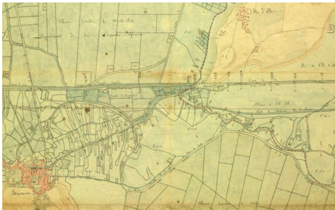
Archives départementales de la Vienne, Date -vers 1835 3 S 244-1