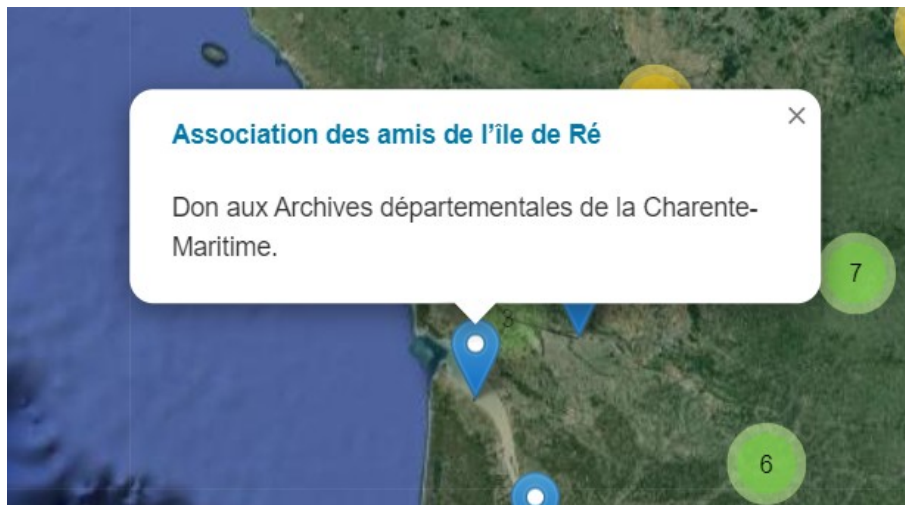
Géolocalisation des fonds d'archives concernant la Charente-Maritime

https://ressources.histoire-environnement.org/Carte?filtre=ressources