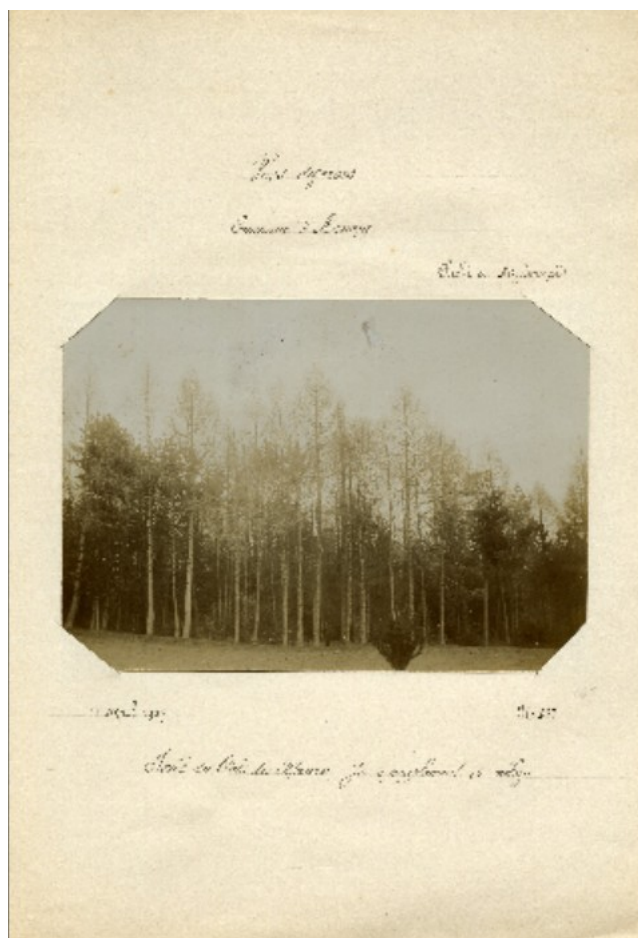
Forêt du Crêt du Maure. Jeune peuplement de mélèze, 1907. Issu du fonds 7 M 2316-3203 Inventaire de la photothèque du service Restauration des terrains de montagne (1886-1938)