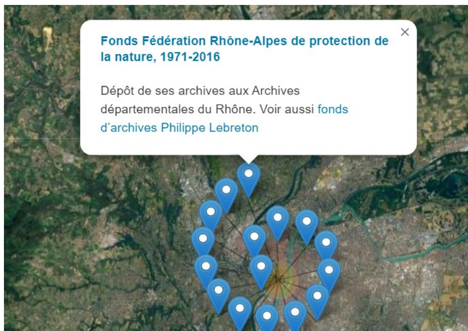
Géolocalisation des fonds d'archives concernant le département du Rhône

https://ressources.histoire-environnement.org/Carte?filtre=ressources