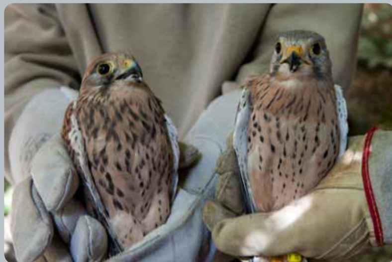
Contrôle d'un faucon crécerelle mâle (à droite) et femelle (à gauche) (Falco tinnunculus)